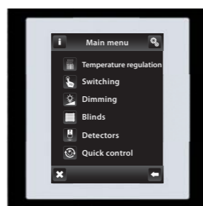
черный / белый