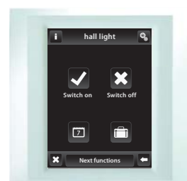
белый / жемчуг