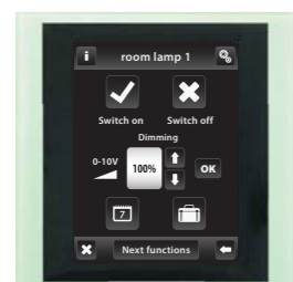
стекло / серый