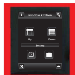
красный / алюминий