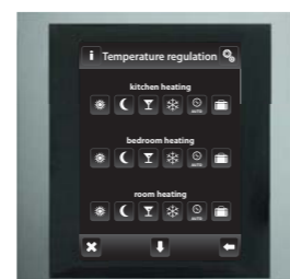
алюминий / темно-серый