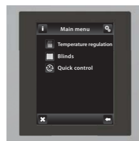
хром / серый