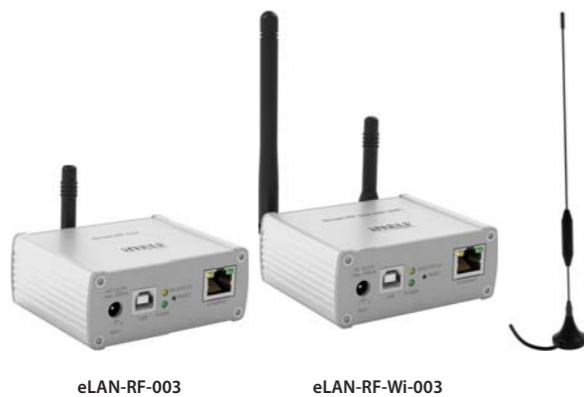
EXTERNÍ ANTÉNA AN-E